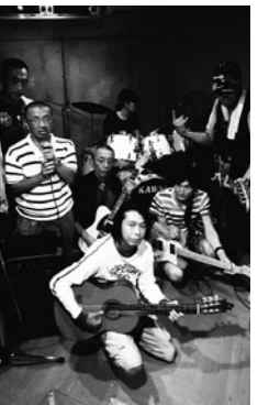
COM 2 ONES (コモーンズ)