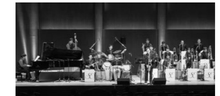
スウィングエコーズ・ジャズ・オーケストラ