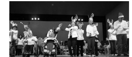
障害児・者グループあすなろ